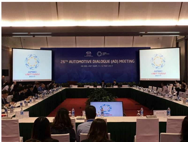
第 26 屆 APEC 汽車對話會議剪影