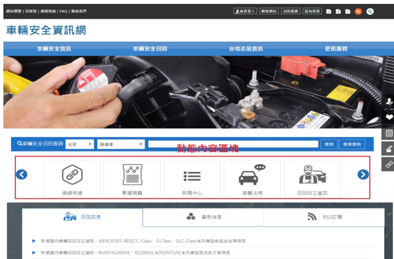
圖二、車輛安全資訊網-前台首頁

主要包含「會員登入」、「車輛安全召回查詢」、「動態內容區塊」、「快訊中心」、「影音資訊」、「統計資訊」及「投票區」等功能，以提供民眾快速查詢車輛召回資訊、瀏覽最新召回訊息及 RSS 訂閱，因考量網站使用上的便利性、訊息的即時性及呈現方式多元化，於動態內容區塊提供功能之快速連結，以讓民眾能夠快速取得相關資訊，如圖二所示。