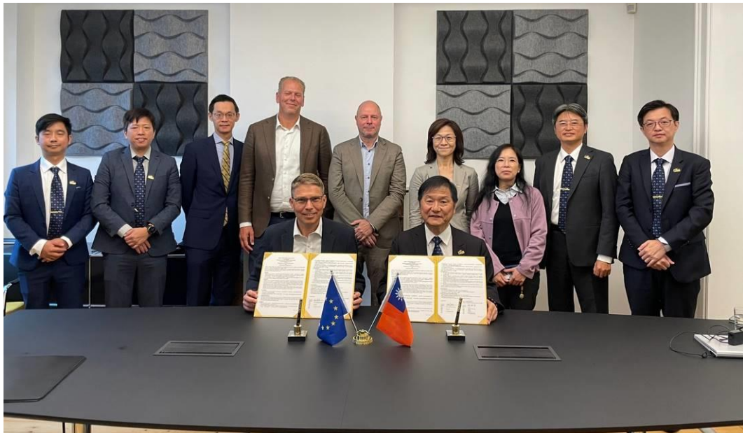
簽署交流合作備忘錄(MOU)儀式出席人員合影