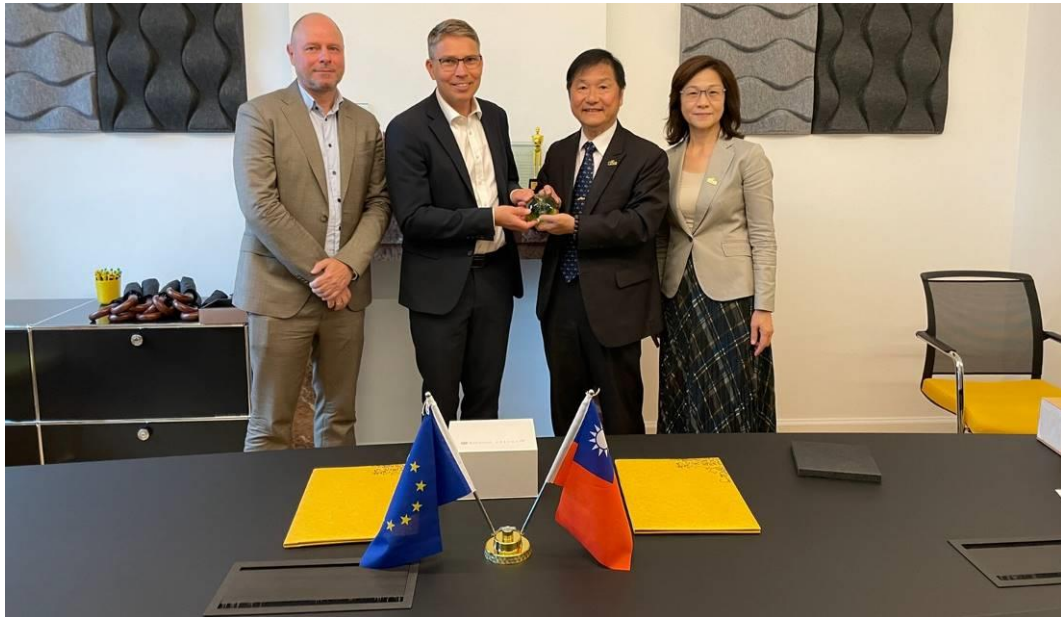
車安中心與 Euro NCAP 簽署交流合作備忘錄(MOU)合影