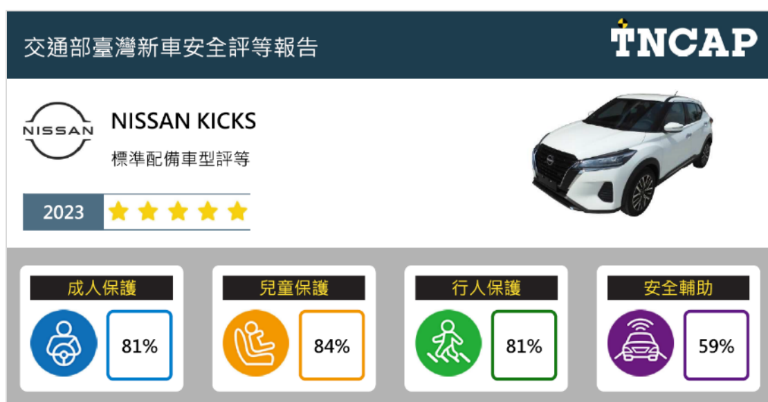
圖 1、NISSAN KICKS 星級評等結果

受評車型 NISSAN KICKS 四大安全領域分別為成人保護領域得分率為 81%、兒童保護領域得分率為 84%、行人保護領域得分率為 81%，以及安全輔助領域得分率為 59%，故依 TNCAP 規章之星級評等平衡標準規定給予該車型整體星級評等為 TNCAP 五顆星，如圖 1 所示。