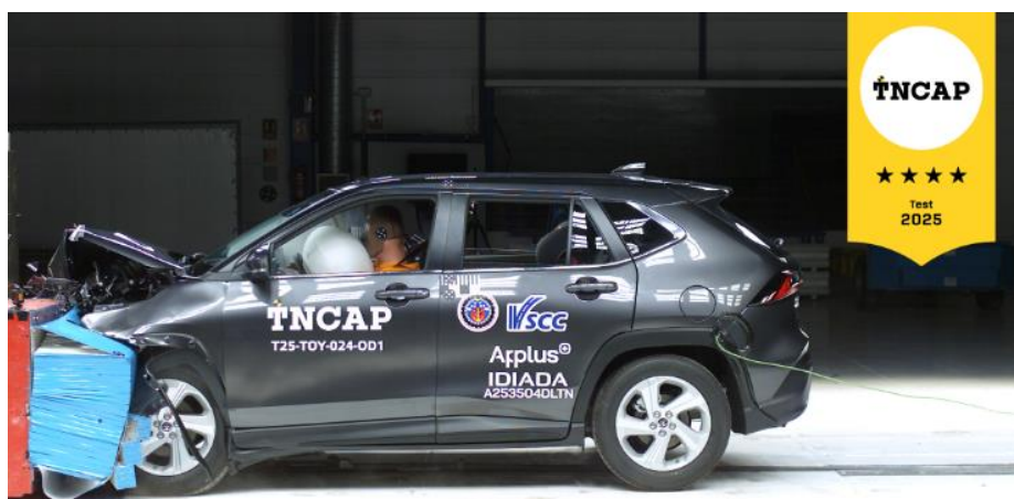
TOYOTA YARIS CROSS